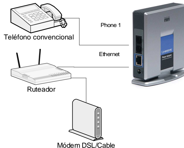
Figura 1. Diagrama de conexión del adaptador telefónico Nota: el ruteador/modem debe tener habilitado DHCP